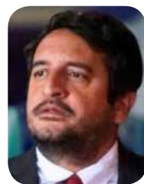
Andrés Manuel López